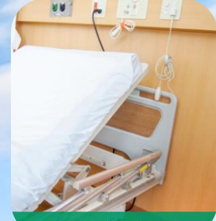
高機能・充実の管内設備