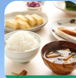
熊本の食材を使ったお食事