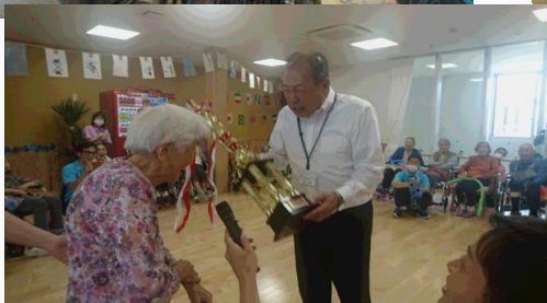
山村施設長より優勝トロフィーの贈呈。