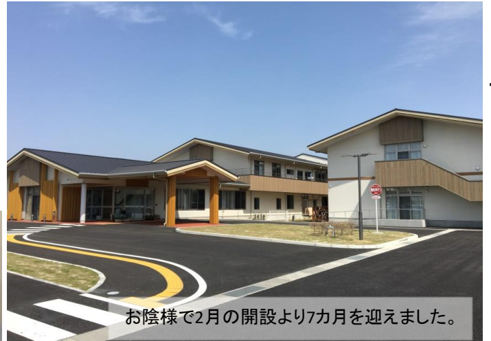
お陰様で2月の開設より7カ月を迎えました。