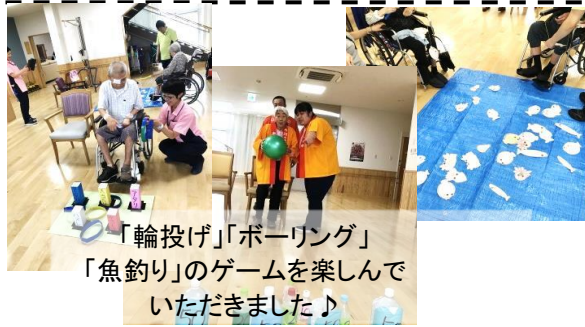
「輪投げ」「ボーリング」「魚釣り」のゲームを楽しんでいただきました♪