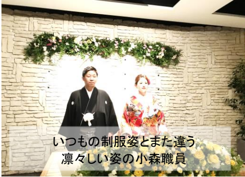
いつもの制服姿とまた違う凛々しい姿の小森職員