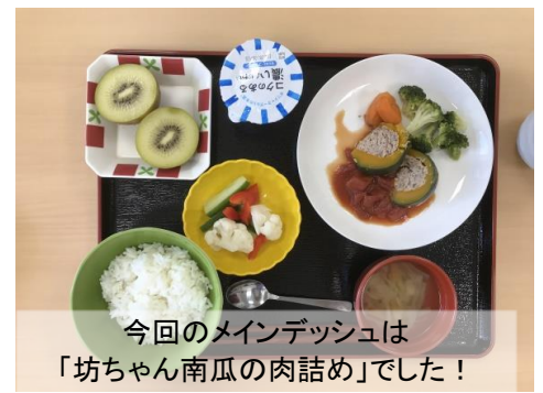
今回のメインデッシュは「坊ちゃん南瓜の肉詰め」でした！