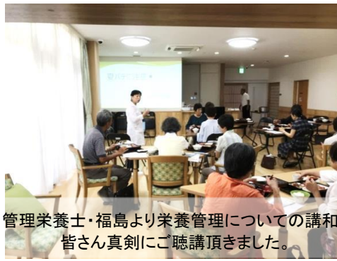
管理栄養士・福島より栄養管理についての講和。皆さん真剣にご聴講頂きました。

8/1 画図地区の方にお越し頂き「栄養の日」企画として健康体操教室・栄養講和・お食事会を開催いたしました。