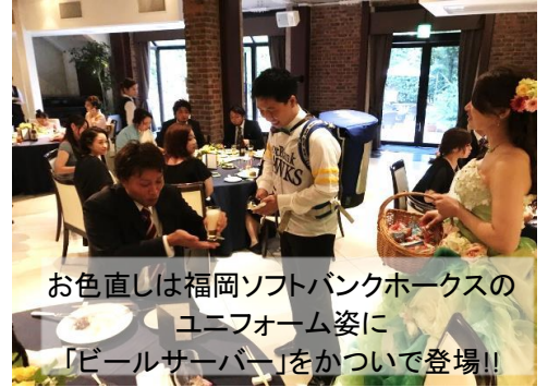
お色直しは福岡ソフトバンクホークスのユニフォーム姿に「ビールサーバー」をかついで登場！！