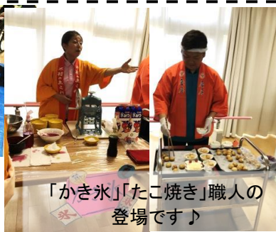
「かき氷」「たこ焼き」職人の登場です♪