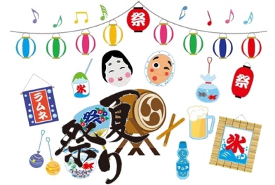
8/17苑内で「ミニ夏祭り」を行いました♪