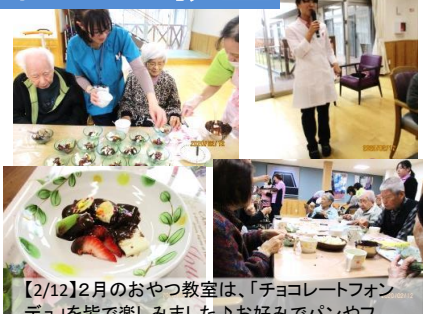
【2/12】2月のおやつ教室は、「チョコレートフォンデュ」を皆で楽しみました♪お好みでパンやフルーツをトッピングして頂き、楽しいおやつ教室になりました。