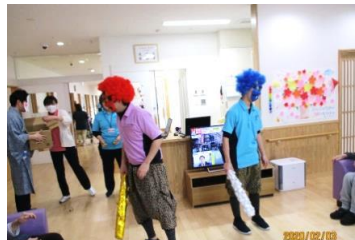
【2/3】「節分」は節分行事として、画図重富苑全体で「豆まき」を行いました♪全7ユニット、事務所、医務室を、怖～い「赤鬼」「青鬼」と、やさしい「福娘」が回り皆さんに豆まきを楽しんで頂きました♪今年も皆さんにより「福」が来ますように！