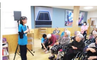
【2/1】画図重富苑祭～開設2周年記念～を開催させて頂きました！イベントの目玉として“全国みちや会”「石本今朝之」さまにお越し頂き全9曲ご披露頂きました！山村施設長より利用者さまへ記念の「紅白饅頭」の贈呈、「鯛の塩窯焼の窯割り」を行いました♪今後もより良いサービスが提供できる様、画図重富苑職員一同邁進してまいります。