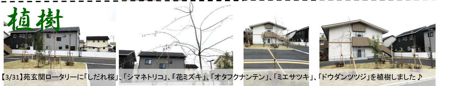
【3/31】苑玄関ロータリーに「しだれ桜」、「シマネトリコ」、「花ミズキ」、「オタフクナンテン」、「ミエサツキ」、「ドウダンツツジ」を植樹しました♪