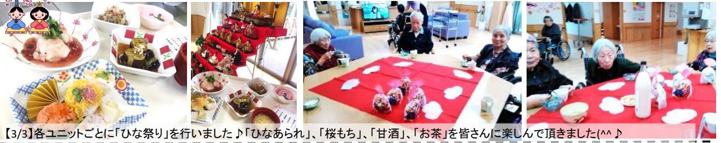
【3/3】各ユニットごとに「ひな祭り」を行いました♪「ひなあられ」、「桜もち」、「甘酒」、「お茶」を皆さんに楽しんで頂きました(^^)

【行事について】新型コロナウイルス感染予防のため苑の集団行事は縮小させて頂いております。いち早い終息を願うと共に、今後も細心の注意を払ってまいります。ご理解ご協力のほどよろしくお願い致します。